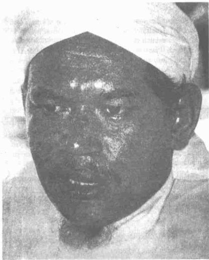
Haji Abdul Hadi Awang